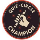
Abb. 7: Badge für Quiz-Circle-Champion

Quiz-Circle-Champion küren. Als weiteren Anreiz können Sie einen Preis ausloben. Die entsprechende Aufgabe können Sie in der Übungssammlung mit dem folgenden Badge markieren: